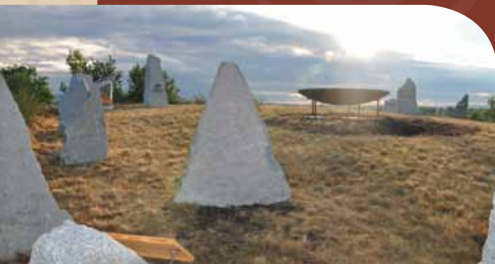
Erlebe die herrliche Rundumsicht mit seinen Nah- und Fernzielen am Tumulus!