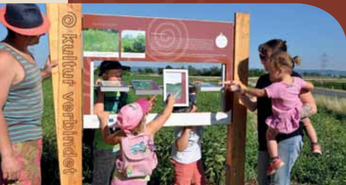
An neun interaktiven Stationen erfährst du mehr über die einzigartige Fauna & Flora am Wagram.