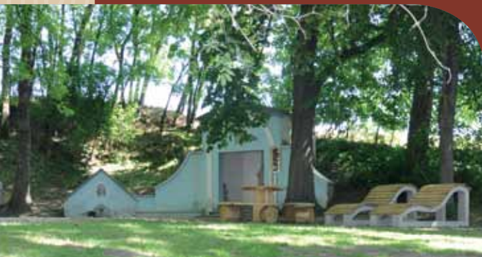
Genieße die wunderschöne Erlebnistrast beim Marienbründl!